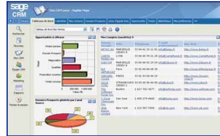
L'utilisateur a accès à des tableaux de bord graphiques, relatifs à son activité, entièrement personnalisables.

Transformez votre Service Clients en un Centre de Profits !